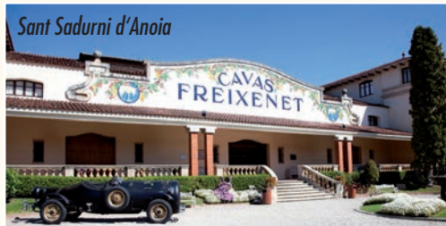
Sant Sadurn d'Anoia

Ausflug Barcelona-Gauditag: Nach dem Frühstück ca. 09.00 Uhr Abfahrt nach Barcelona . Besuch der beiden Gaudi-Häuser „ Casa Mila & Casa Batlló “ (beide Gebäude werden von der RL von aussen erklärt). Anschl. Weiterfahrt zur Sagrada Familia . Bei einem gemütlichen Spaziergang und Besichtigung der Kathedrale erklärt die RL alles Wissenswerte und beantwortet Ihre Fragen. (inkl. Eintritt). Ca. 15.30 Uhr Weiterfahrt zum Parc Güell und Besichtigung der farbenfrohen Gebäude (inkl. Eintritt). Rückfahrt zum Hotel – Abendessen. (fak. € 40.-)