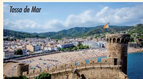
Tossa de Mar